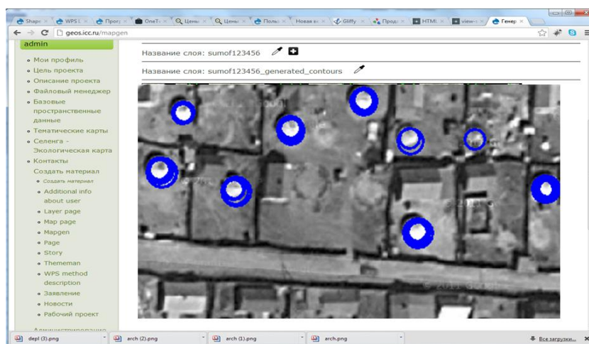
Рис. 3. Модуль отображения результатов.

Для отображения результатов разработан модуль отображения. Данный модуль позволяет отображать пространственные данные в различных форматах, доступных с помощью библиотеки GDAL [4]. В частности векторные файлы в формате SHP и данные СУБД PostgreSQL, растровый данные в формате GeoTIFF. Основывается модуль на библиотеках OpenLayers, Mapserver. Позволяет задавать способ отображения данных, в частности градиентная заливка в зависимости от значений объектов, интервалы значений и т.д.